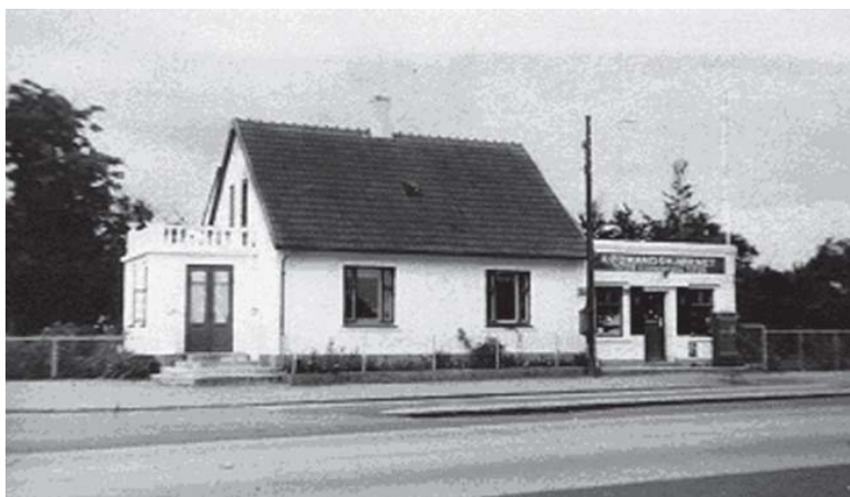
Huset her, hvor der som det fremgår en gang var købmand, er bygget i 1905 og er dermed 100 år gammelt. Huset ligger stadig på Gl. Køge Landevej.