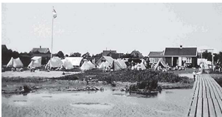
I 1930'erne kunne sommergæsterne bo i telt ved Brøndby Strand.

Brøndby Strand Bevaringsforening og Tranen.