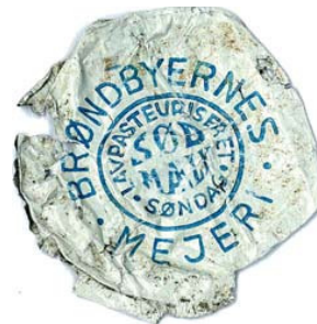
Sødmælk og søndag. Kapslen, som må ha' ligget i jorden en del år, fortæller om mælkeleverancer på flaske i Brøndby Strand.

Og de tider, hvor man fik bragt mælk til døren, er for længst forbi. Ω